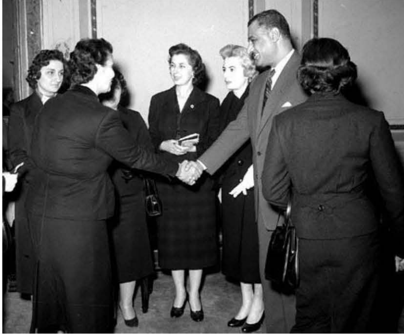
استقبال وفد نسائي لبناني ١٩٥٧/١/١٣